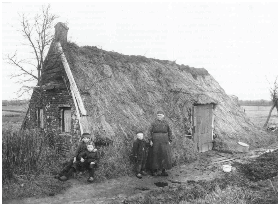
Zo zagen de hutten, die rond 1820 op Niesoord werden gebouwd er ongeveer uit. De foto komt niet uit Midwolda, maar ergens uit Drenthe.